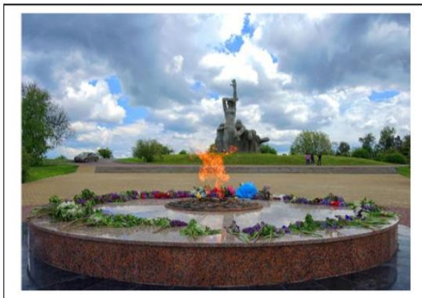
Мемориал жертвам фашизма «Змиёвская балка»

Наш долг — бережно хранить память о тех страшных событиях, чтобы они не повторились!