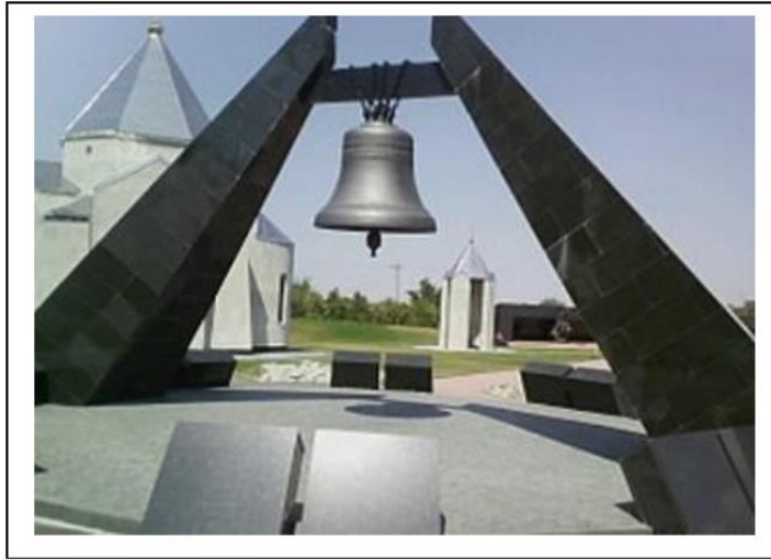
Мемориал детям концлагеря «Красный»